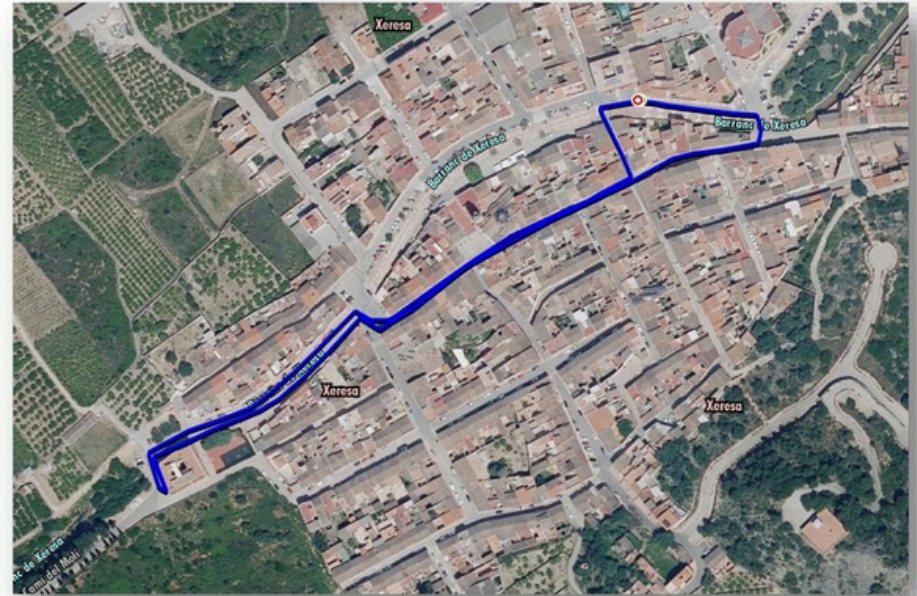
DETALLE CIRCUITO BENJAMINES y PRE-BENJAMINES