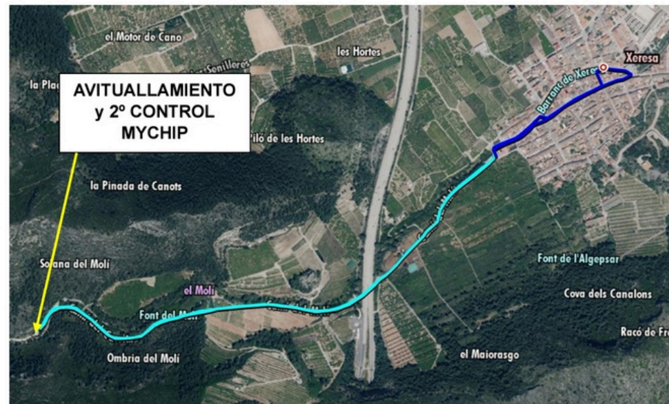
VISTA GENERAL TRAZADO PRUEBA (en ortofoto)

DESNIVEL POSITIVO: 68 metros DESNIVEL NEGATIVO: 68 metros