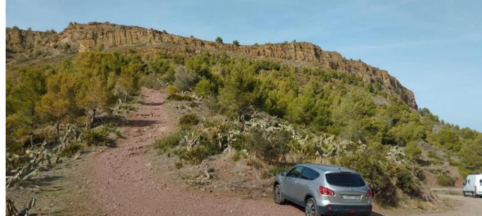
FIGURA DE PROTECCIÓN O CATALOGACIÓN DEL PARAJE NATURAL: