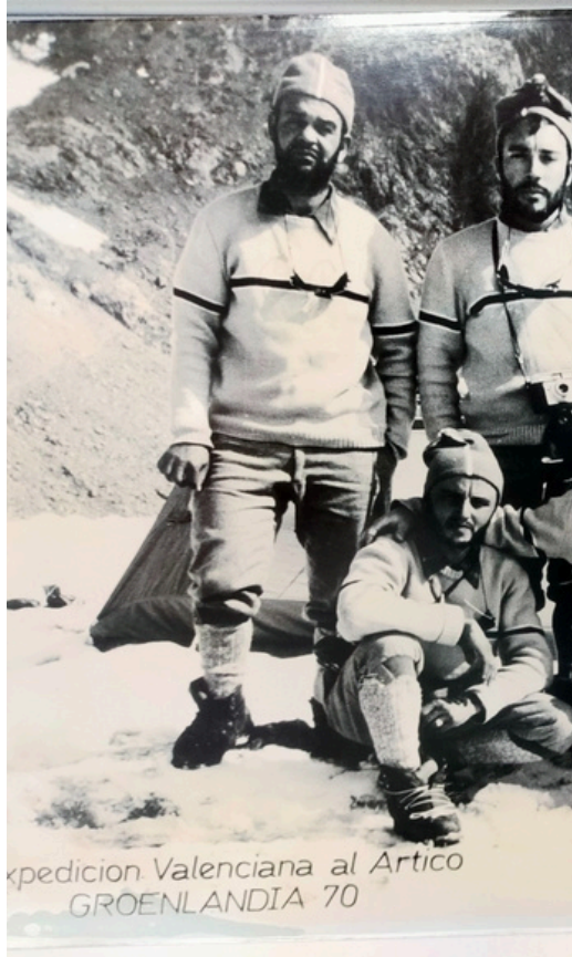
Expedició Valenciana al Artico GROENLANDIA 70